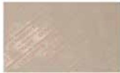
CovidSafe- nolietots pārklājums